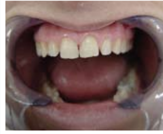
Estetik dolgu ile aralığın kapatılması