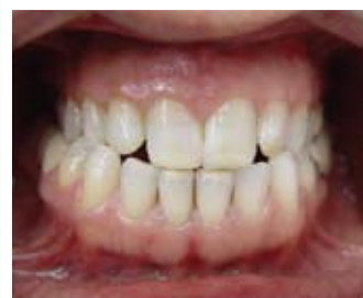
Estetik restorasyon sonrası