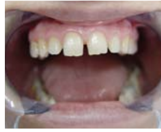
Kesici dişler arasında aralık