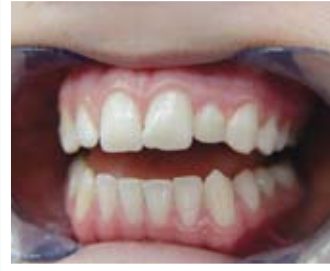
Estetik restorasyon sonucu