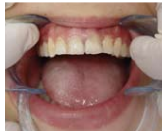
Kırık dişlerin restore edilmiş hali