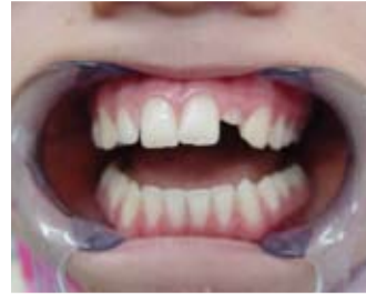
Yan keser dişte şekil anomalisi