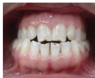
Alt ve üst kesicilerde mine deformasyonu