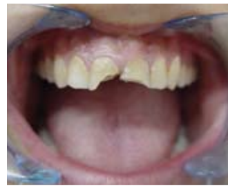
Üst kesici dişlerde kırık