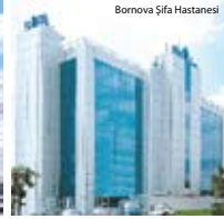
Bornova Şifa Hastanesi