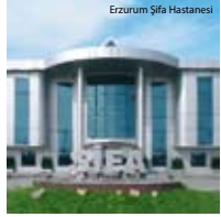
Erzurum Şifa Hastanesi