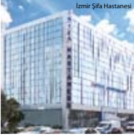
Izmir Şifa Hastanesi